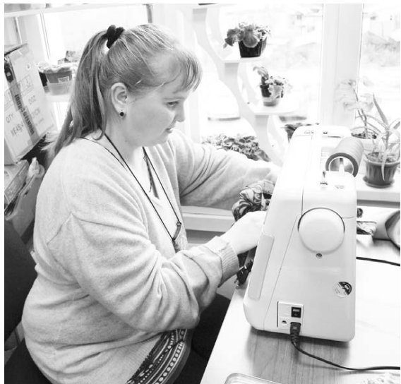
Это удивительные мастера, умеющие работать аккуратно и кропотливо

расте сложнее, в каком-то - легче), влиться в общество. Но отвергать расстройство неумно, нужно научиться с этим жить, и тем, кто не болен, этому научиться даже важнее. К сожалению, чаще всего тем, как решить эту проблему, озабочиваются лишь тогда и только те, кого заболевание коснулось лично с рождением собственного ребенка с подобным диагнозом-приговором. Но обеспечение доступной среды - это дело не сотни-двух пытающихся обеспечить своим детям право на будущее родителей, это задача становления цивилизованного и гуманного общества. Сейчас немецкие и российские специалисты дорабатывают электронное издание «Доступная среда для людей с РАС» с рекомендациями, в которые войдут также предложения, принятые во время круглых столов в Москве и Нижнем Новгороде. Пособие будет опубликовано на сайтах партнеров проекта для распространения информации среди широкого круга экспертов в этой области.