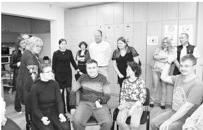
Воспитанники интеграционных мастерских сопровождаемой занятости людей с ментальной инвалидностью «Верас» всегда рады гостям