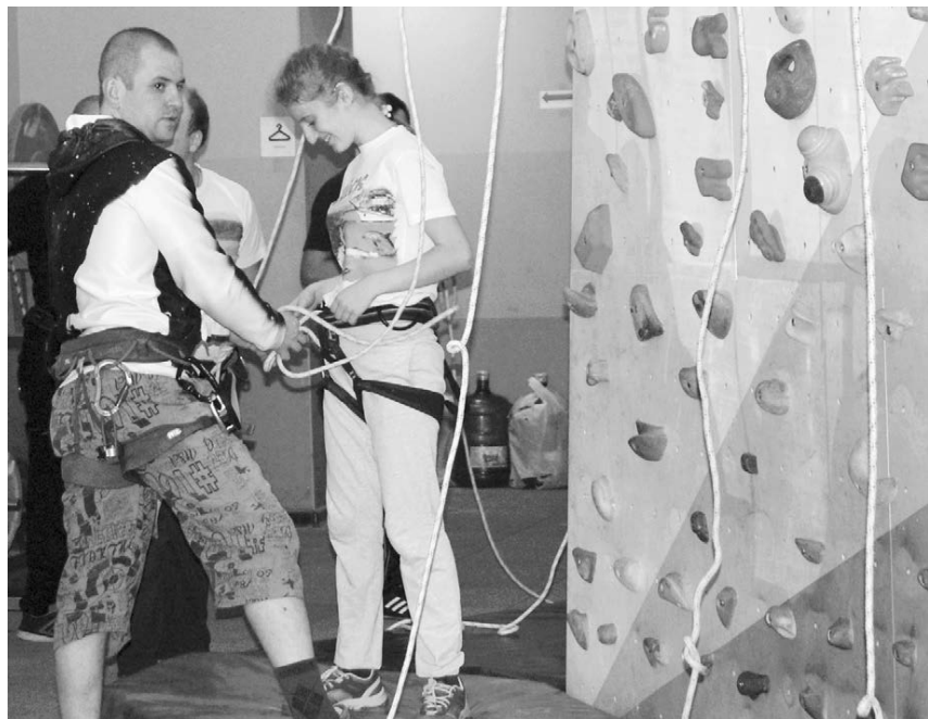
Для тех, кто пришел в «Ладь», нет недосягаемых высот

На круглом столе в администрации губернатора Нижегородской области с участием представителей власти, общественных организаций и родителей прозвучал весьма серьезный посыл: для аутиста очень важно оставаться собой, а не становиться кем-то другим. Это заболевание позволяет некоторым из тех, у кого оно есть (а аутизм не проявляется внезапно, но диагностировать его в каком-то воз-