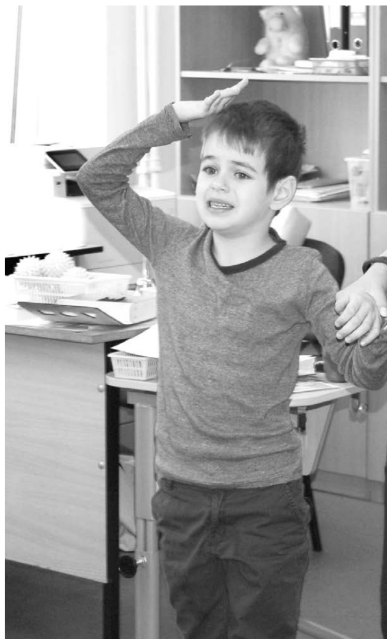
Такие раннимые дети

ственного сопровождения людей, имеющих любые нарушения в ментальной сфере, в том числе с аутизмом. Важно обеспечить доступность всех областей жизнедеятельности людям с аутизмом по аналогии с тем, как это доступ-