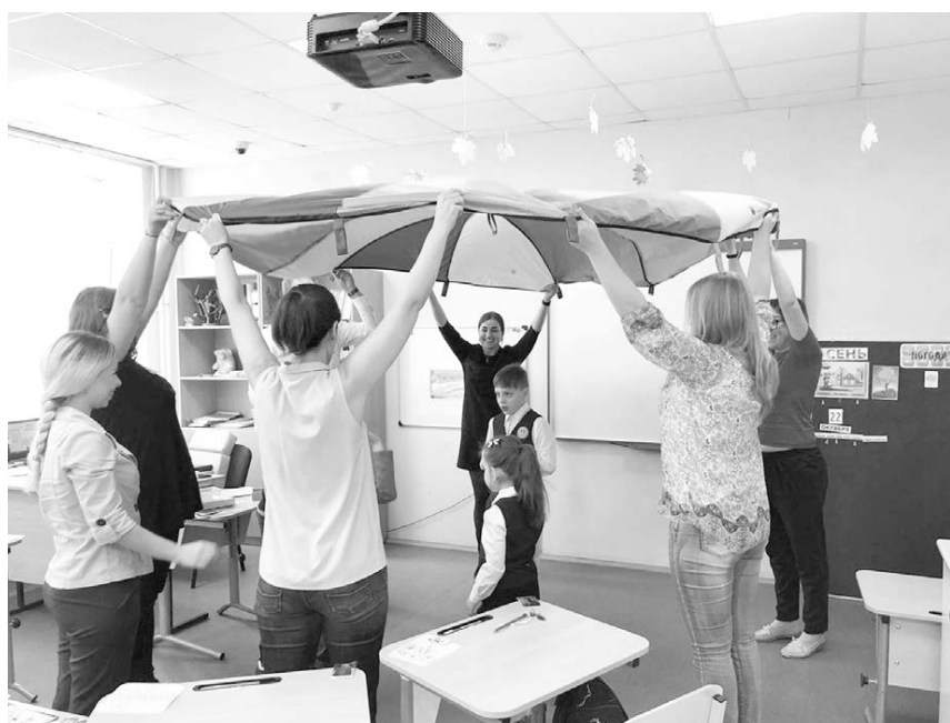
Они так хотят оказаться под куполом любви окружающих!