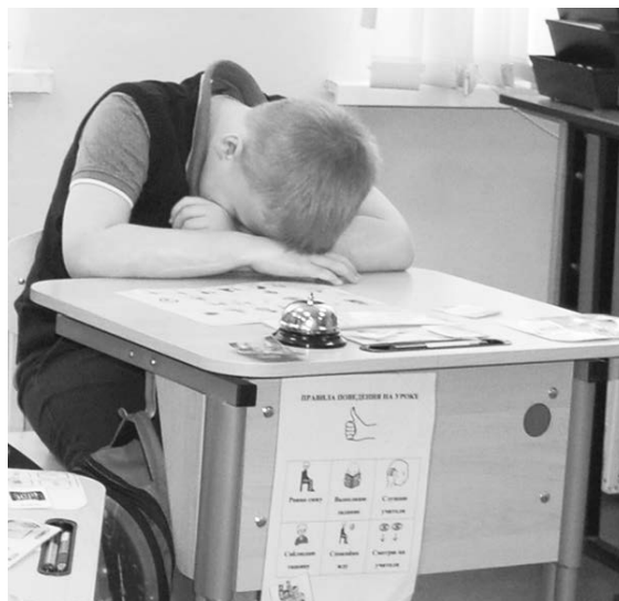
Когда твои батарейки разряжаются быстрее, чем у других

расте сложнее, в каком-то - легче), влиться в общество. Но отвергать расстройство неумно, нужно научиться с этим жить, и тем, кто не болен, этому научиться даже важнее. К сожалению, чаще всего тем, как решить эту проблему, озабочиваются лишь тогда и только те, кого заболевание коснулось лично с рождением собственного ребенка с подобным диагнозом-приговором. Но обеспечение доступной среды - это дело не сотни-двух пытающихся обеспечить своим детям право на будущее родителей, это задача становления цивилизованного и гуманного общества. Сейчас немецкие и российские специалисты дорабатывают электронное издание «Доступная среда для людей с РАС» с рекомендациями, в которые войдут также предложения, принятые во время круглых столов в Москве и Нижнем Новгороде. Пособие будет опубликовано на сайтах партнеров проекта для распространения информации среди широкого круга экспертов в этой области.